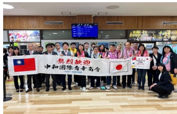
圖3 大仙市人員於秋田機場熱烈歡迎本校