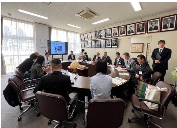
圖7 大曲中學校長介紹辦學理念及交流