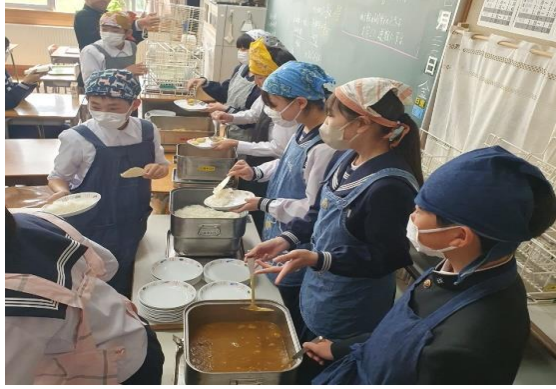
圖9 大曲中學～班級午餐風景