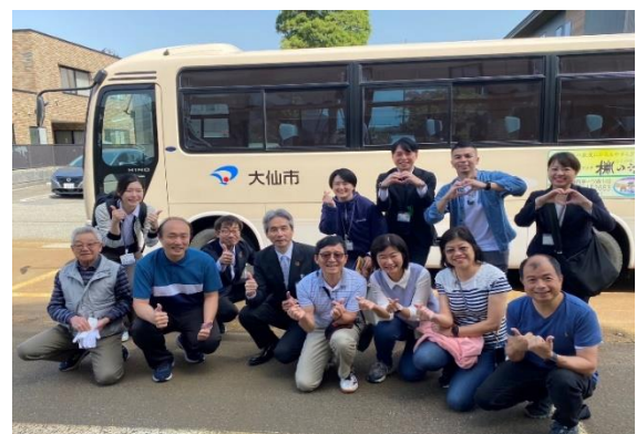
圖14 大仙市教育委員長與大家拜別