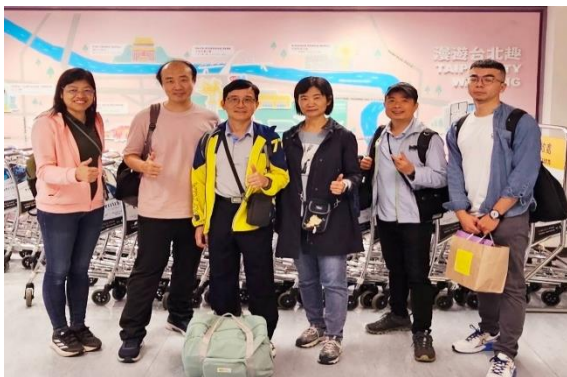
圖2 松山機場準備登機前往日本

本次參訪活動共計四天三夜。第一天從松山機場出發至日本秋田縣大仙市(圖2、圖3)，這天晚上參與大仙市一般社團法人大曲青年會議所舉辦的歡迎會，與日本大曲市市長、教育委員長、大曲中學校長等相見歡(圖4)。