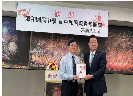
圖6 拜訪大仙市政廳，交流、交換禮物