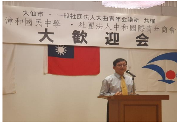
圖4 大仙市一般社團法人大曲青年會議歡迎會

第二天上午前往大仙市政廳拜訪市長及相關行政部門(圖5)，進行交流、交換禮物(圖6)。之後前往大曲中學參訪，入班觀課(數學、歷史、體育、美術)，視察校舍設施，及社團活動，瞭解不同國家教育文化的面貌，並且簽訂締結姊妹校協議書(圖7、圖8、圖9、圖10)。