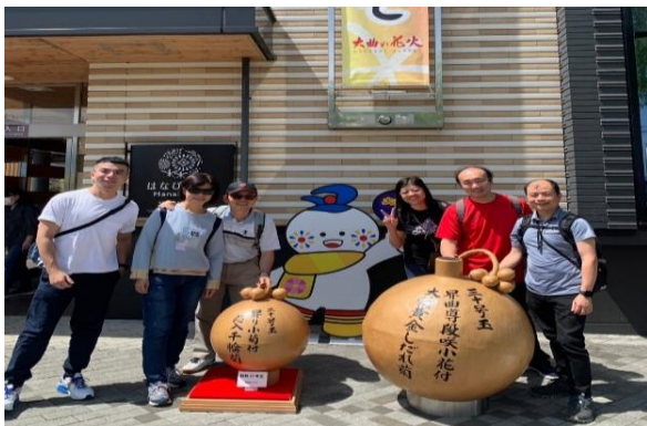
圖11 參訪大曲花火傳統文化繼承資料館 領會大曲花火的演進歷程

第三天於參訪大曲花火傳統文化繼承資料館，領會大曲花火的演進歷程(圖11)，以及文化遺產－舊池田氏庭園(圖12)，晚上受大仙市政廳邀請參與大曲花火～春之章(圖13)。第四天早上大仙市教育委員長特地至飯店與大家拜別(圖14)，觀光課長亦特地陪同抵達秋田機場，於當日晚上九點抵達台灣松山機場，結束這次有意義的教育交流行程。