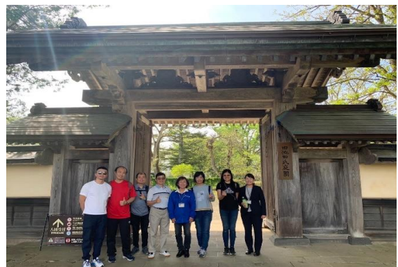
圖12 參訪文化遺產－舊池田氏庭園