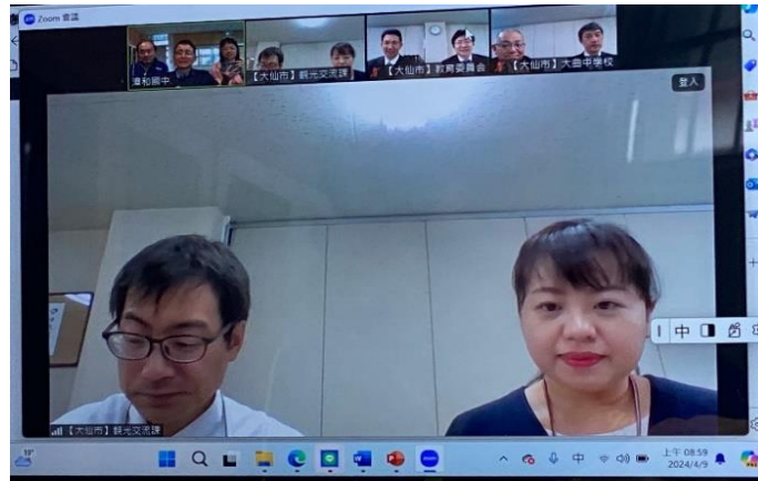
圖1 行前共識會議(線上)。由本校校長、教務、學務主任與日本大仙市觀光交流課、教育委員會人員、大曲中學校長商討締結協議書內容，及參訪行程規畫

為了讓本次締結姊妹校暨參訪活動過程中有更多收穫，特別在出發前規畫線上會議，與大仙市政府代表、大曲中學校長共同商討締結協議書內容，及參訪行程規畫(圖1)。