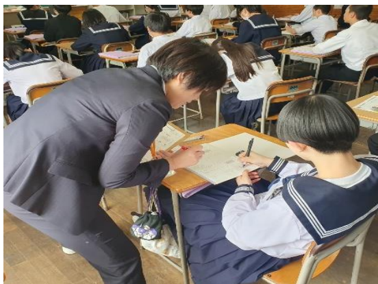
圖8 大曲中學入班觀課～數學課風景