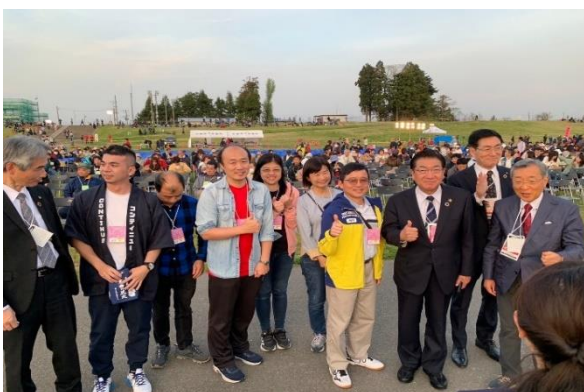
圖13 大曲花火～春之章 本校師長與大仙市 市長、教育委員長合影